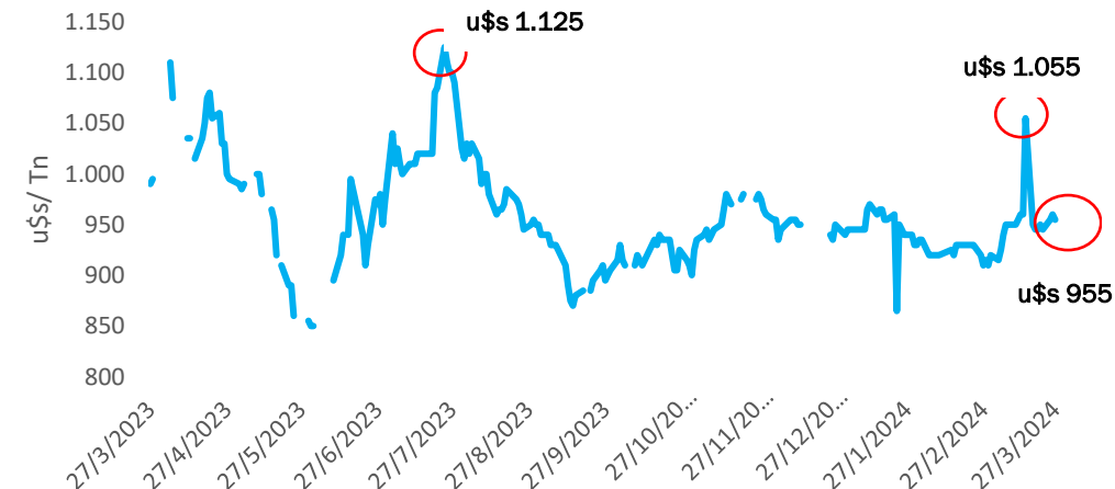
GRÁFICO 1: ROTTERDAM ACEITE DE GIRASOL

Mercados: en el informe de marzo, Oil World estimó una menor producción global de semilla, pero incrementó la producción de aceite traccionada principalmente por Rusia y en menor medida por Ucrania y Argentina.